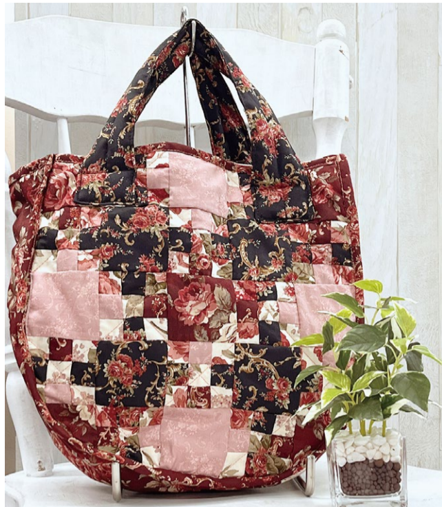
本体仕上がりサイズ 33cm×33cm 持ちて含まず